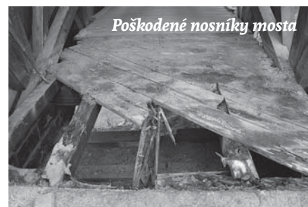
Poškodené nosníky mosta

Samotnej rekonštrukcii na jeseň 2015 predchádzala žiadosť Pamiatkovému úradu o vydanie stanoviska k žiadosti o dotácie a neskôr o súhlas k prácam na moste. Počas rekonštrukcie dohliadali na práce na moste pracovníci Krajského pamiatkového úradu a statik, ktorí dbali najmä na dodržiavanie technologického postupu, ako aj na použitý materiál a farby. Pristúpilo sa k oprave zdemolovanej fošňovej podlahy a hnilobou poškodených pozdĺžnych nosníkov a prahov, ktoré boli vyrobené z hĺbkovo impregnovaných železničných podvalov. Poškodené a vymenené nosníky boli zosilnené