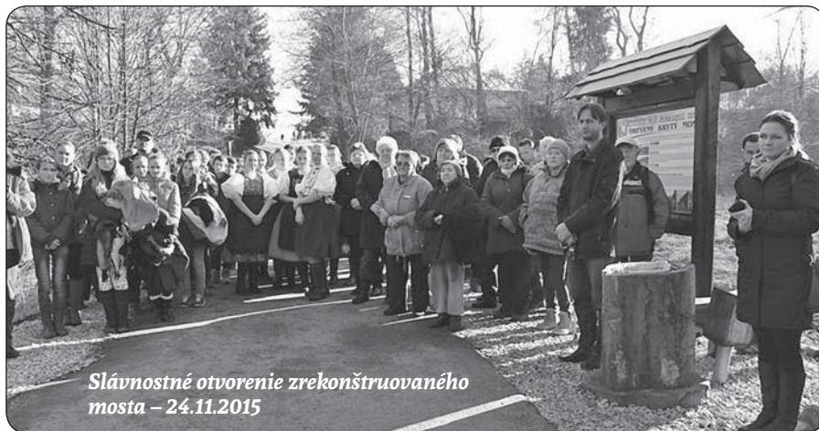
Slávnostné otvorenie zrekonštruovaného mosta – 24.11.2015