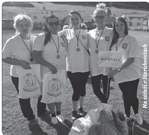
Na súťaži v Harichovciach