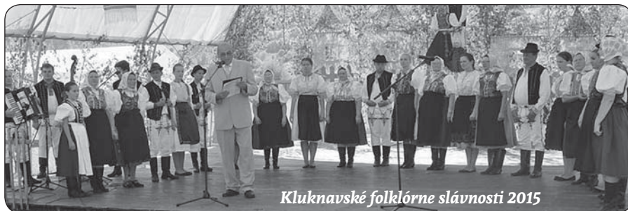
Kluknavské folklórne slávnosti 2015

Niet v roku veľa dní, ktoré by boli opradené toľkým množstvom obyčají, zvykov