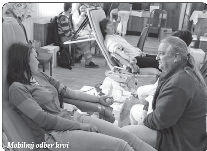
Mobilný odber krvi

Obec Kluknava v spolupráci s Národnou transfúznou službou Košice zorganizovala 26. februára 2016 mobilný odber krvi. Odberu sa zúčastnilo 16 dobrovoľníkov, ktorí týmto skutkom pomohli doplniť zásoby život zachraňujúcej červenej tekutiny. Už po druhýkrát sa obec Kluknava pripojila k tomuto dôležitému a nenahraditeľnému humánnemu činu, akým darovanie